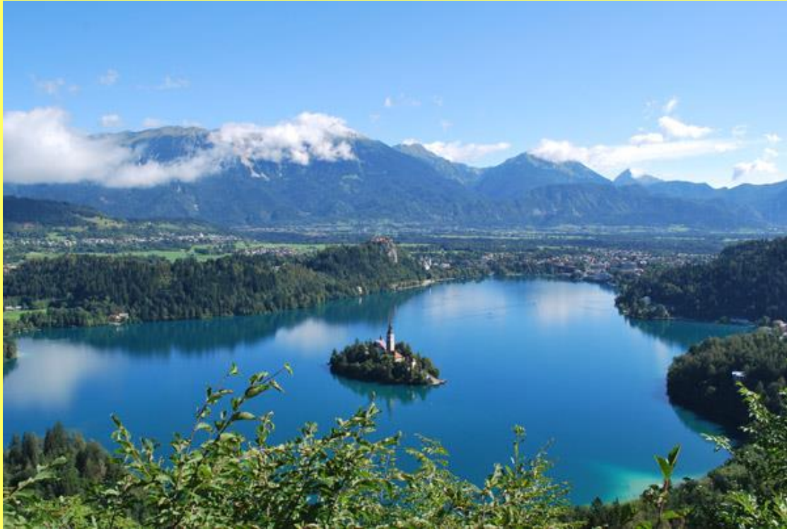
Veldes und Veldeser See