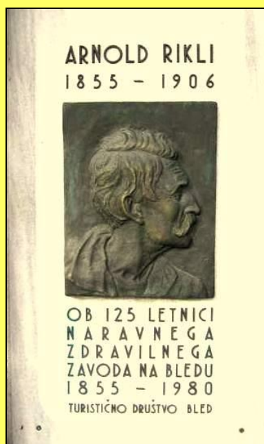
Gedenktafel in Veldes/Bled

In Veldes, im Hause des Sonnendoktors Rikli, war diese Wahrheit geahnt, bedacht und entworfen worden.