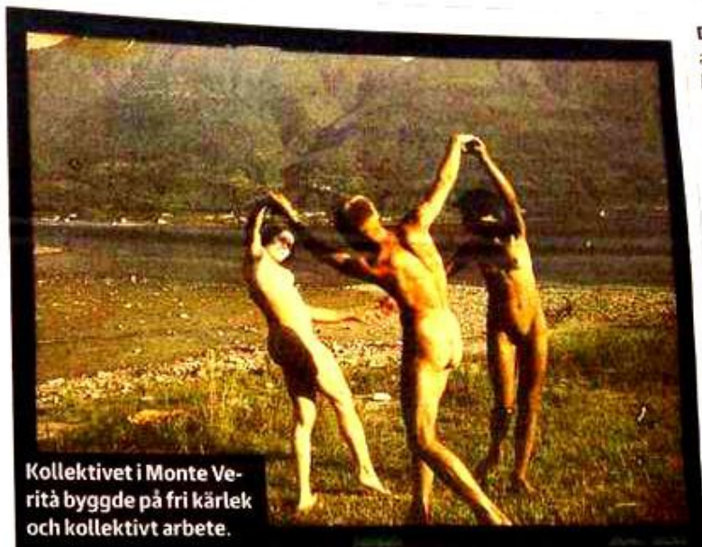
Kollektivet i Monte Verità byggde på fri kärlek och kollektivt arbete.

För att klara livets nödtorft öppnade de ett sanatorium 1902, med vegetarisk mat, fasta, solbad och vattenkurer. Ryktet om Monte Verità spreds snabbt i kulturradikala kretsar och lockade företrädare för fri dans som Mary Wigman och Isadora Duncan, följt av psykoanalytiker som Otto Gross. Hit vallfärdade även författare som Erich Maria Remarque och Hermann Hesse, konstnärer som Hugo Ball och Paul Klee, revolutionärer som Pjotr Kro-