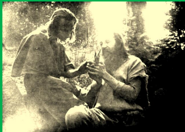
In Dresden mit Freunden, 1925

Aus „Hochherrlichkeit“ zum „Gärtnergeist“ dem Trottelidol der Jahrtausende Heilstern der Welt.