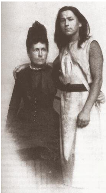
Fidus met zijn moeder. Interessant haar...

De symbolistische schilder Karl Wilhelm Diefenbach (1851-1913) werd een apostel van de alternatieve levensstijl, naturisme en vredesactivisme nadat hij, volgens eigen zeggen met uitsluitend natuurmethoden was genezen van de tyfus. Met vrouw en kinderen trok hij in de commune Humanitas , waar zijn vrouw in 1890 stierf. Omdat zijn leerstellingen in München niet op bijzonder veel sympathie konden rekenen, trok hij weg uit de grote stad. Hij ontmoette de jonge schilder Hugo Höppener, die door hem Fidus gedoopt werd. Getweeën maakten ze het grote schaduwfries Per aspera ad astra . Een schilderijtentoonstelling in Wenen maakte hem in 1892 in één slag beroemd, maar door malversaties van de leiding van de Oostenrijkse Kunstvereniging raakte hij vervolgens al zijn doeken kwijt.