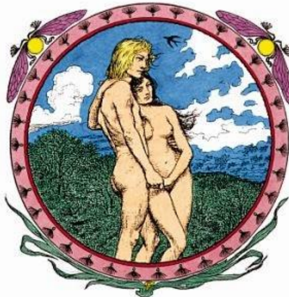
Een vignette van Fidus

De illustrator Fidus (1868-1949) ontwikkelde zich tot een belangrijke en baanbrekende psychedelische kunstenaar, vijftig jaar voordat de hippiebeweging in de rockmuziek met dergelijke iconografie op de proppen kwam voor haar platenhoesontwerpen.